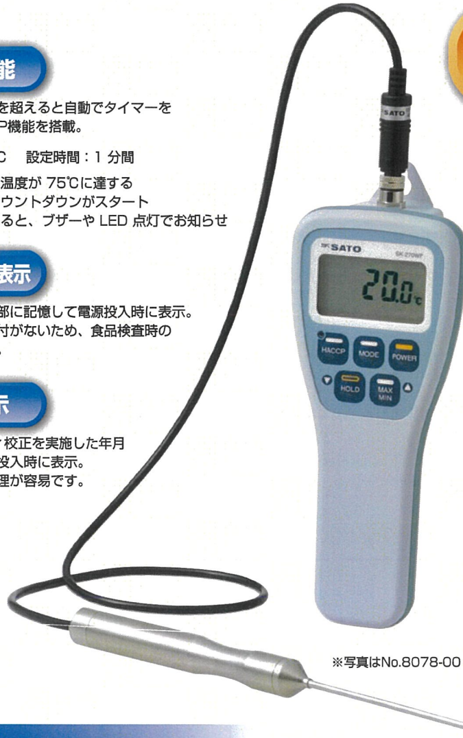
※写真はNo.8078-00 標準センサ付